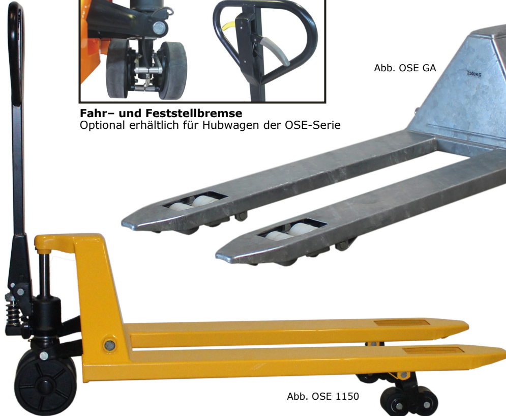
Abb. OSE 1150

Fahr- und Feststellbremse Optional erhältlich für Hubwagen der OSE-Serie